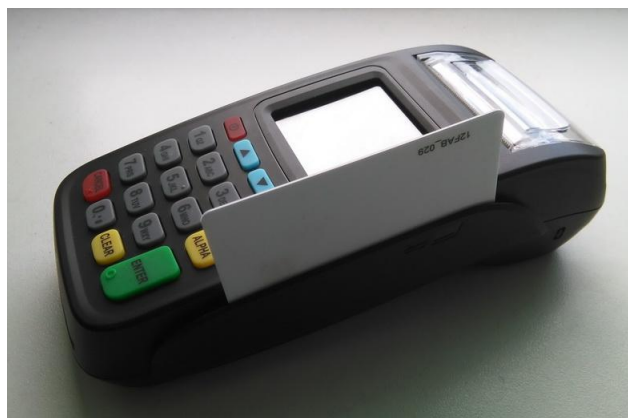
Рис. 4. Считывание карты с магнитной полосой

Для того чтобы считать информацию с магнитной карты, проведите ее в любом направлении через специально предназначенный ридер для карт с магнитной полосой. Магнитная лента должна располагаться в нижней части карты, повернутая магнитной полосой к экрану терминала. Важно не перемещать карту слишком медленно. (Рис.4)