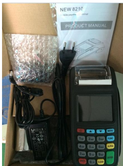
Рис. 2. Комплект поставки терминала New8210