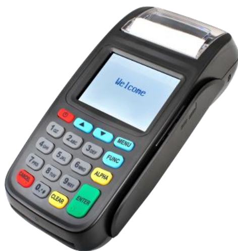
Рис. 1. Терминал New8210

Внешний вид терминала представлен на Рис. 1.