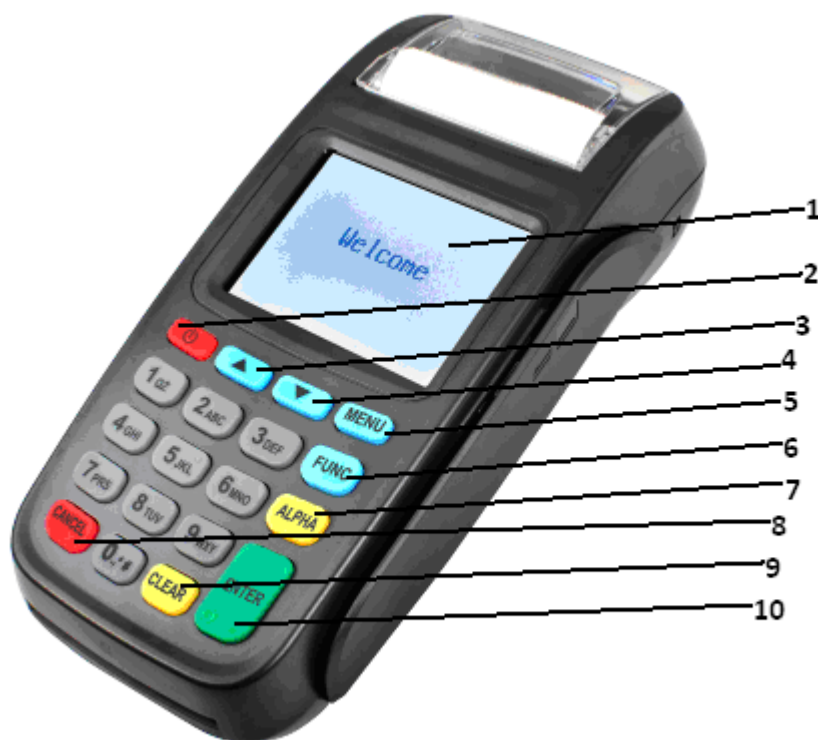
Рис. 3. Внешний вид терминала

Внешний вид терминала с указанием клавиш представлен на Рис. 3.